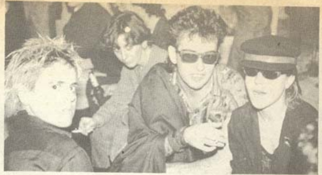
La gente de Neo Ama de Kass por La Mode